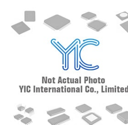
IRF7470TRPBF. IR IR SOP8