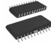
A8287SLBTR Allegro MicroSystems, LLC IC REG LNB SUPPLY/CTRL 24SOIC