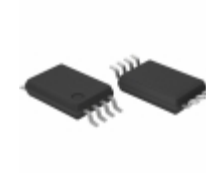
BR93G76FV-3AGTE2 LAPIS Semiconductor MICROWIRE BUS 8KBIT(512X16BIT) E