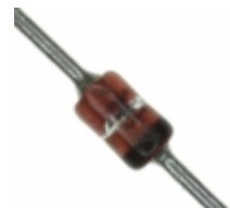
1N4937-TP Micro Commercial Co DIODE GEN PURP 600V 1A DO41