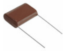
ECQ-E4225JF Panasonic Electronic Components CAP FILM 2.2UF 5% 400VDC RADIAL