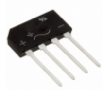
G2SB20-E3/51 Electro-Films (EFI) / Vishay DIODE GPP 1.5A 200V GBL