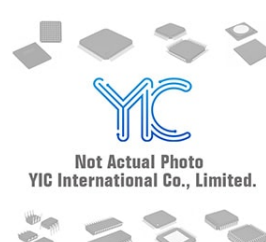
MIC5252-4.75BM5 MICREL MICREL SOT23-5