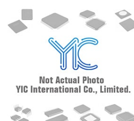
MIC5252-4.75YM5 TR MICREL MICREL SOT23-5