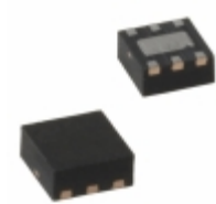
MIC5252-4.75BML-TR Microchip Technology IC REG LDO 4.75V 0.15A 6MLF