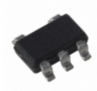
MIC5252-4.75BM5-TR Microchip Technology IC REG LDO 4.75V 0.15A SOT23-5