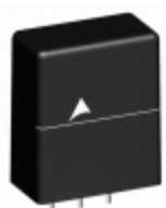
B72220T2381K105 EPCOS (TDK) VARISTOR 620V 10KA ENCASED