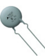
B72220U2151K501 EPCOS 20MM, 150V , 125 DEG.C OPERATING