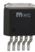
MIC29501-3.3WU Microchip Technology IC REG LDO 3.3V 5A TO263-5