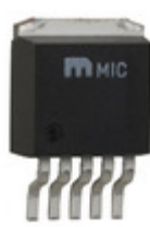
MIC29501-3.3BU TR Microchip Technology IC REG LDO 3.3V 5A TO263-5