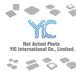
MIC29500-3.3WU MICREL MICREL TO-263