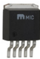
MIC29501-3.3WU-TR Microchip Technology IC REG LDO 3.3V 5A TO263-5