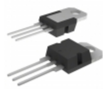
MIC29500-5.0BT Microchip Technology IC REG LDO 5V 5A TO220-3