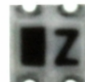
EHF-FD1513 Panasonic Electronic Components POWER DIVIDER 1720-1790MHZ