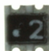
EHF-FD1546 Panasonic Electronic Components DIRECTIONAL COUPLER 800 MHZ 17DB