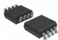
TC7WP3125FK(T5L,F) Toshiba Semiconductor and Storage IC BUS SWITCH SPST DUAL US8