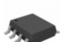
TC7WHU04FU(TE12L) Toshiba Semiconductor and Storage IC INVERTER TRIPLE 8-SSOP