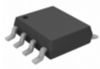
TC7WHU04FU(TE12L) Toshiba Semiconductor and Storage IC INVERTER TRIPLE 8-SSOP