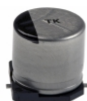
EEE-TK1K101AM Panasonic Electronic Components CAP ALUM 100UF 20% 80V SMD