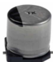
EEE-TK1K470AQ Panasonic Electronic Components CAP ALUM 47UF 20% 80V SMD