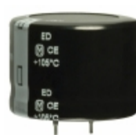
EET-ED2G221EA Panasonic Electronic Components CAP ALUM 220UF 20% 400V SNAP