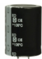
EET-ED2G391EA Panasonic Electronic Components CAP ALUM 390UF 20% 400V SNAP