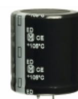
EET-ED2G471EA Panasonic Electronic Components CAP ALUM 470UF 20% 400V SNAP