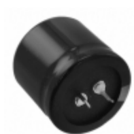
EET-ED2G331EA Panasonic Electronic Components CAP ALUM 330UF 20% 400V SNAP