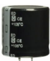
EET-ED2G331DA Panasonic Electronic Components CAP ALUM 330UF 20% 400V SNAP