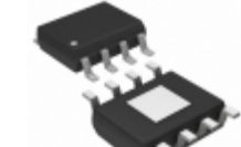
ADP2302ARDZ-R7 Analog Devices Inc. IC REG BUCK ADJ 2A 8SOIC