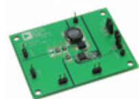
ADP2302-EVALZ ADI (Analog Devices, Inc.) EVAL BOARD FOR ADP2302