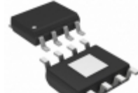
ADP2302ARDZ-3.3-R7 Analog Devices Inc. IC REG BUCK 3.3V 2A 8SOIC