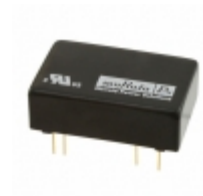
NCS6D1205C Murata Power Solutions Inc. CONVERT DC/DC +/-5V 600MA THRU