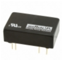
NCS6D1215C Murata Power Solutions Inc. CONVERT DC/DC +/-15V 200MA THRU