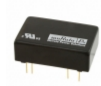
NCS6D1212C Murata Power Solutions Inc. CONVERT DC/DC +/-12V 250MA THRU