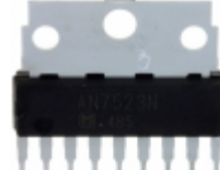
AN7523N Panasonic Electronic Components IC AUDIO AMP 4W SIL-9 W/FIN