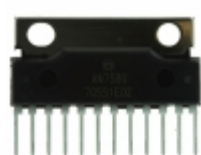
AN7580 Panasonic Electronic Components IC AUDIO AMP 25W 2CH SIL-12