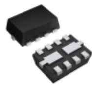
ZXTD3M832TA Diodes Incorporated TRANS 2PNP 40V 3A 8MLP