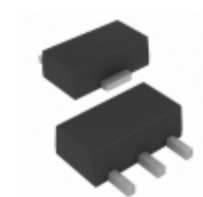
TC54VN3302EMB713 Microchip Technology IC VOLT DET 3.3V NCH OD SOT89-3