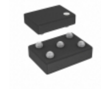
AT24C32E-UUM0B-T Microchip Technology IC EEPROM 32KBIT 1MHZ 5WLCSP