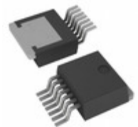
BD4271FP2-CE2 LAPIS Semiconductor IC REG LINEAR 4.9V 550MA TO263-7