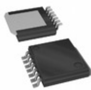
BD4271HFP-CTR LAPIS Semiconductor IC REG LINEAR 4.9V 550MA HRP7