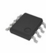
BD4269FJ-CE2 LAPIS Semiconductor IC REG LIN POS ADJ 200MA 8SOP-J