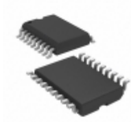
MIC58P42YWM-TR Microchip Technology IC DRVR LATCH 8BIT SER IN 18SOIC