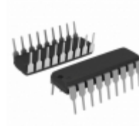
MIC58P42YN Microchip Technology IC DRVR LATCH 8BIT SER IN 18-DIP