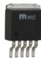
MIC59300-1.2WU Microchip Technology IC REG LDO 1.2V 3A TO263-5