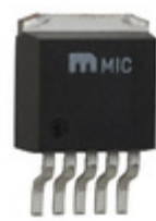
MIC59300-1.2WU-TR Microchip Technology IC REG LDO 1.2V 3A TO263-5