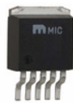
MIC59300-1.2WU Microchip Technology IC REG LDO 1.2V 3A TO263-5