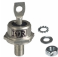
VS-85HFL40S02 Electro-Films (EFI) / Vishay DIODE GEN PURP 400V 85A DO203AB