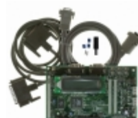
AT91SAM7A1-EK Micrel / Microchip Technology BOARD EVAL FOR AT91SAM7A1