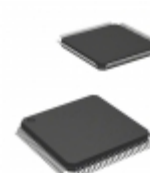
AT91SAM7A3-AU Microchip Technology IC MCU 32BIT 256KB FLASH 100LQFP