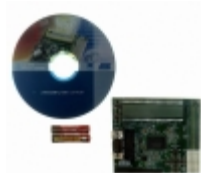
AT91SAM7L-STK Micrel / Microchip Technology KIT EVAL FOR AT91SAM7L