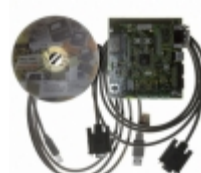
AT91SAM7A3-EK Micrel / Microchip Technology KIT EVAL FOR AT91SAM7A3