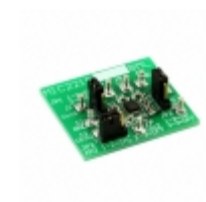
MIC2215-PPPBML-EV Micrel / Microchip Technology EVAL BOARD TRIPLE CAP LDO