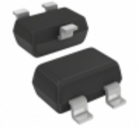
AT-32032-TR2G Avago Technologies (Broadcom Limited) TRANS NPN BIPO 5.5V 30MA SOT-323