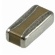
06125A102KAT2V AVX Corporation CAP CER 1000PF 50V NP0 0612