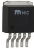
MIC39301-1.65BU Microchip Technology IC REG LDO 1.65V 3A TO263-5