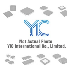
MIC39300-2.5BUTR MICREL MIC39300-2.5BUTR MICREL