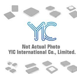
MIC39300-5.0WU MICREL MICREL TO-263