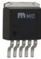
MIC39301-1.65BU TR Microchip Technology IC REG LDO 1.65V 3A TO263-5