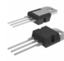
MIC39300-2.5WT Microchip Technology IC REG LDO 2.5V 3A TO220-3