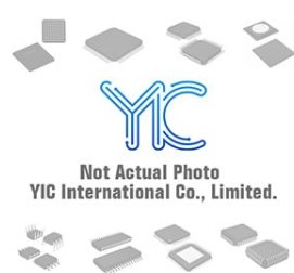
MIC39300-2.5WU TR MICERL MIC39300-2.5WU TR MICERL