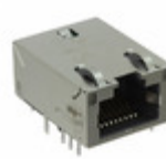
A829-1J1T-KM Bel MAGJACK 1P 1GBT AUTO ETHERNET