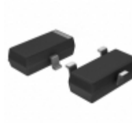
BC859BMTF AMI Semiconductor / ON Semiconductor TRANS PNP 30V 0.1A SOT-23