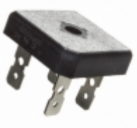
GBPC5010-G Comchip Technology RECT BRIDGE GPP 1000V 50A GBPC