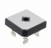
GBPC5010-BP Micro Commercial Co BRIDGE RECT 50A 1KV GBPC