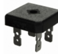
GBPC5008-G Comchip Technology RECT BRIDGE GPP 800V 50A GBPC