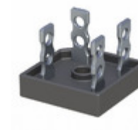
GBPC5010 T0G TSC (Taiwan Semiconductor) BRIDGE RECT 1P 1KV 50A GBPC40