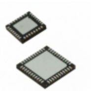
ATMEGA644PR231-MU Microchip Technology IC RF TXRX+MCU 802.15.4/ISM