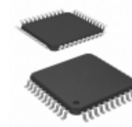
ATMEGA644PR231-AU Microchip Technology IC RF TXRX+MCU 802.15.4 44-TQFP