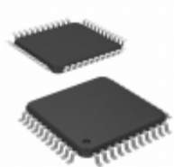
ATMEGA644PR212-AU Microchip Technology IC RF TXRX+MCU 802.15.4 44-TQFP