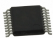
MCP4361-502E/ST Microchip Technology IC DIGITAL POTENTIOMETER 20TSSOP