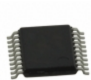
MCP4361-503E/ST Microchip Technology IC DIGITAL POTENTIOMETER 20TSSOP