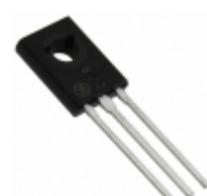
BD437TG ON Semiconductor TRANS NPN 45V 4A TO-225AA