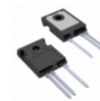
IXTH06N220P3HV IXYS Corporation MOSFET N-CH