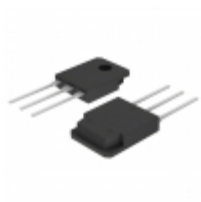
IXTH10N100D2 IXYS MOSFET N-CH 1000V 10A TO-247