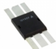
IXZ308N120 IXYS RF MOSFET N-CHANNEL DE375