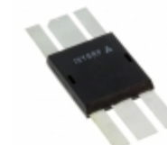
IXZ210N50L2 IXYS RF RF MOSFET N-CHANNEL DE275