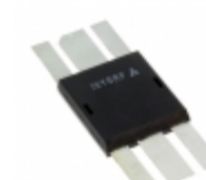
IXZ308N120 IXYS RF MOSFET N-CHANNEL DE375