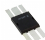
IXZ316N60 IXYS RF RF MOSFET N-CHANNEL DE375