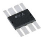
IXZ2210N50L2 IXYS RF RF MOSFET 2 N-CHANNEL DE275