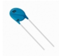
MOV-10D271KTR Bourns Inc. VARISTOR 270V 2.5KA DISC 10MM