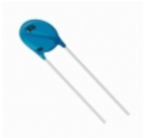
MOV-10D271K Bourns Inc. VARISTOR 270V 2.5KA DISC 10MM