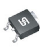
TSM70N380CP ROG TSC (Taiwan Semiconductor) MOSFET N-CHANNEL 700V 11A TO252