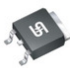
TSM70N600CP ROG TSC (Taiwan Semiconductor) MOSFET N-CHANNEL 700V 8A TO252