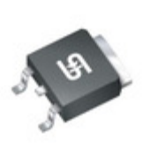
TSM70N1R4CP ROG TSC (Taiwan Semiconductor) MOSFET N-CH 700V 3.3A TO252