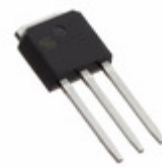
TSM70N380CH C5G TSC (Taiwan Semiconductor) MOSFET N-CH 700V 11A TO251