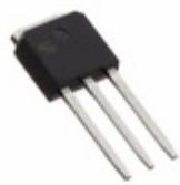
TSM70N1R4CH C5G TSC (Taiwan Semiconductor) MOSFET N-CH 700V 3.3A TO251