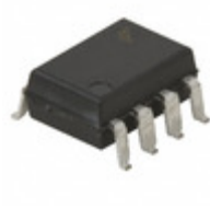
6N139SD Fairchild/ON Semiconductor OPTOISO 2.5KV DARL W/BASE 8SMD