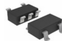
NCP500SN28T1G ON Semiconductor IC REG LDO 2.8V 0.15A 5TSOP