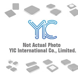
DS2711Z/T DALLAS DALLAS SOP