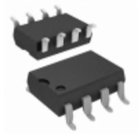
HCPL-3700-520 Broadcom Limited OPTOISO 5KV DARL 8-DIP GULL WING