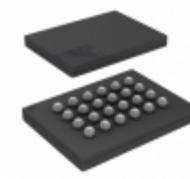
IS25LP128-JGLE-TR ISSI (Integrated Silicon Solution, Inc.) IC FLASH 128M SPI 24TFBGA