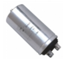
C44APGP5100ZE0J KEMET CAP FILM 10UF 5% 1.2KVDC RADIAL