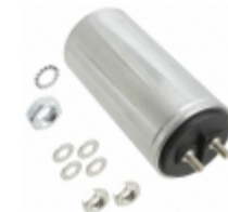
C44APFP4500ZB0J KEMET CAP FILM 5UF 5% 1.2KVDC SCREW