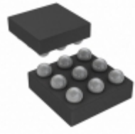
MAX14594EEWL+T Maxim Integrated IC ANALOG SWITCH 5V DPDT WLP