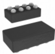
MAX14591EWA+ Maxim Integrated IC XLATR BIDIR L-LVL 2CH 8WLP