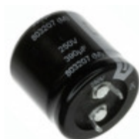
EET-HC2E471JA Panasonic Electronic Components CAP ALUM 470UF 20% 250V SNAP