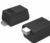
BAS521BF Nexperia BAS521B/SOD523/SC-79