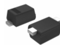
BAS521,315 Nexperia USA Inc. DIODE GEN PURP 300V 250MA SOD523