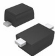
BAS521-7 Diodes Incorporated DIODE GEN PURP 300V 250MA SOD523