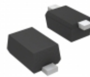
BAS5202VH6327XTSA1 International Rectifier (Infineon Technologies) DIODE SCHOTTKY 45V 750MA SC79-2