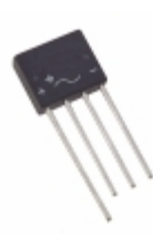
KBL01-E4/51 Electro-Films (EFI) / Vishay RECTIFIER BRIDGE 4A 100V KBL