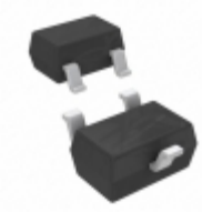
DDTC115TUA-7-F Diodes Incorporated TRANS PREBIAS NPN 200MW SOT323