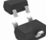
DDTC122LU-7 Diodes Incorporated TRANS PREBIAS NPN 200MW SOT323