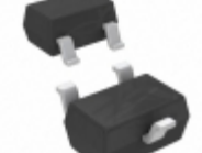
DDTC115TUA-7 Diodes Incorporated TRANS PREBIAS NPN 200MW SOT323