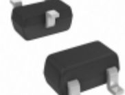
DDTC115TE-7-F Diodes Incorporated TRANS PREBIAS NPN 150MW SOT523