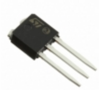
ACST4-7CH STMicroelectronics TRIAC 700V 4A IPAK