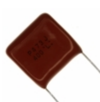
ECQ-P4473JU Panasonic Electronic Components CAP FILM 0.047UF 5% 400VDC RAD