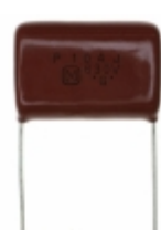
ECQ-P6104JU Panasonic Electronic Components CAP FILM 0.1UF 5% 630VDC RADIAL