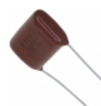
ECQ-P4563JU Panasonic Electronic Components CAP FILM 0.056UF 5% 400VDC RAD