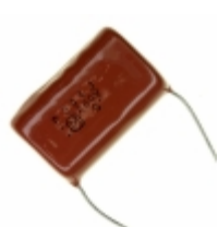
ECQ-P4394JU Panasonic Electronic Components CAP FILM 0.39UF 5% 400VDC RADIAL