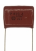
ECQ-P4823JU Panasonic Electronic Components CAP FILM 0.082UF 5% 400VDC RAD