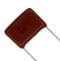
ECQ-P6103JU Panasonic Electronic Components CAP FILM 10000PF 5% 630VDC RAD